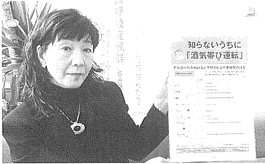
ポスターを持つ作本副理事長

健康サポート事業を 全日本トラック協会S 行うNPO法人ヘルス AS対策事業指定機 ケアネットワーク(関、大阪府城東区)では