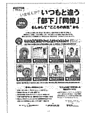
6 ストレス対策② (周囲チェック) 周りの人の気づきチェックと対応ポイントを解説