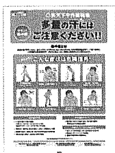
④熱中症対策 症状と予防法、 水分補給、対処法を解説