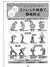
③腰痛対策 手軽にできる ストレッチ体操を解説