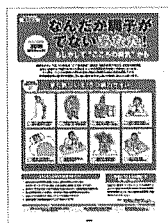
⑤ストレス対策① (自己チェック) 自己で行ううつ病の前兆チェックと対処法を解説