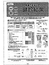
⑨健康診断結果の活用 健診結果をもとにチェック項目や毎日の過ごし方を解説