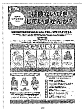
②睡眠時無呼吸症候群(SAS)対策 SASの症状と影響・予防策を解説