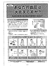
⑦高血圧対策 生活習慣の見直し ポイントを解説

「X」とはよく言われるが、やはりお酒の好き な方は飲む。飲むな、で はなく『どれくらい飲 むといつまでアルコール が抜けないか』と自 己管理の意識を持つ方 話している。 このポスターはトラ サイズは317mm ×468mm。一枚15 00円、パウチ加工版 3000円(いずれも 税別)。問合せは06 69651366番まで。