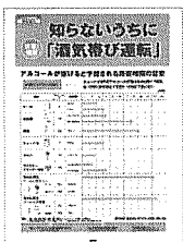
①残酒対策 酒類と量で アルコール代謝を解説