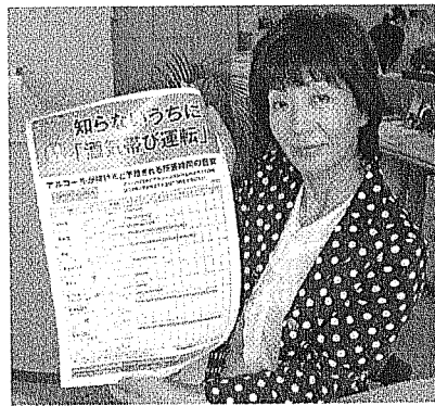
ポスターを持つ作本理事

「残酒対策」「睡眠時無呼吸症候群(SAS)対策」「腰痛対策」「熱中症対策」に続いて「ストレス対策①(自己チェック編)」を新たに製作し、販売を開始した。